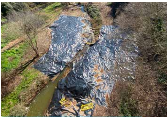
Cobertura dels rizomes de la riera del Mujal amb plàstics biodegradables per eliminar els canyers

la riera del Mujal representa una oportunitat per recuperar el nostre patrimoni natural, millorar el seu sistema fluvial, augmentar la biodiversitat, estabilitzar les ribes i reduir els riscos associats a inundacions i incendis. Més enllà del control d'una espècie invasora, es tracta de restablir la dinàmica pròpia dels ecosistemes de ribera i reforçar-ne la resiliència davant de la crisi climàtica. Vegeu al blog del Sarment una versió més extensa d'aquest article.