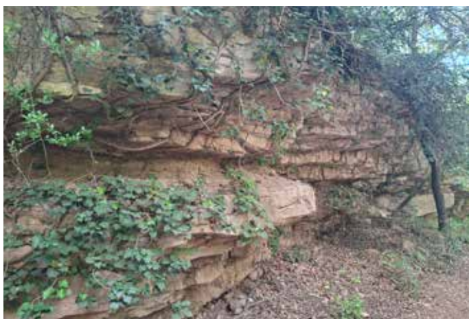
La balma de la cruïlla de Cal Castellà, a la Rabeia