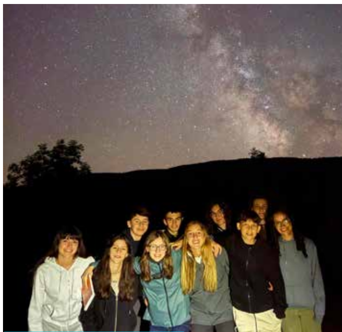
Grup del programa de la Fundació La Pedrera

un seminari d'astronomia al Pirineu, amb una estada de quinze dies combinant teoria i pràctica, a part d'activitats lúdiques. Després vam haver d'escriure un article científic; el meu tractava sobre Les nanes marrons, un tipus d'estrella sobre el qual encara hi ha moltes incògnites. Jo em vaig centrar en com s'originen aquests cossos celestes, comparant dades d'estrelles de massa com la del nostre Sol amb dades de nanes marrons, intentant concloure si aquestes últimes es podrien haver format a través del mateix mecanisme que les estrelles de massa mitjana o no. Gràcies a aquest treball, aquest proper estiu faré una estada a l'Institut d'Astrofísica de les Canàries, on podré observar i aprofundir en l'estudi de les estrelles. El tercer any hauré d'escollir un centre de recer-