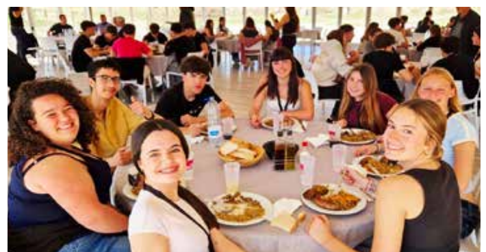
Dinar del premi Rotary

És un programa que té una durada de tres anys. L'estiu passat vaig participar en >>>