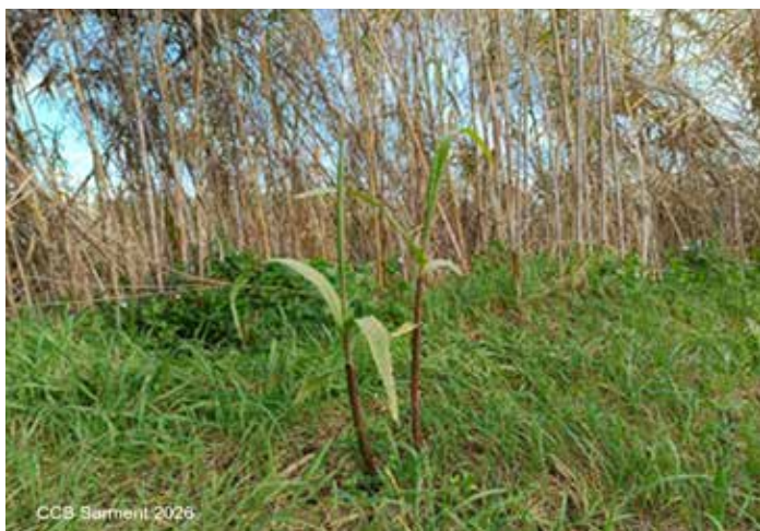
Ràpid creixement dels rebrots de canya en una mota estassada

La seva eliminació és complexa i requereix actuacions sostingudes en el temps. Entre les tècniques més >>>