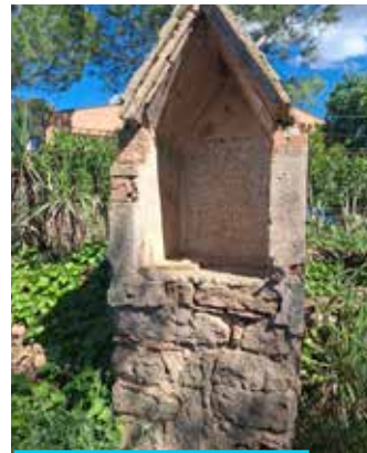
L'estructura d'una de les antigues capelletes que seguïen fins al castell, on es feien les parades del Via Crucis

Els materials vermellosos del recorregut, de pedra sorrenca i margues, pertanyen a la Formació Artés (de l'Oligocè, fa uns 30 milions d'anys).