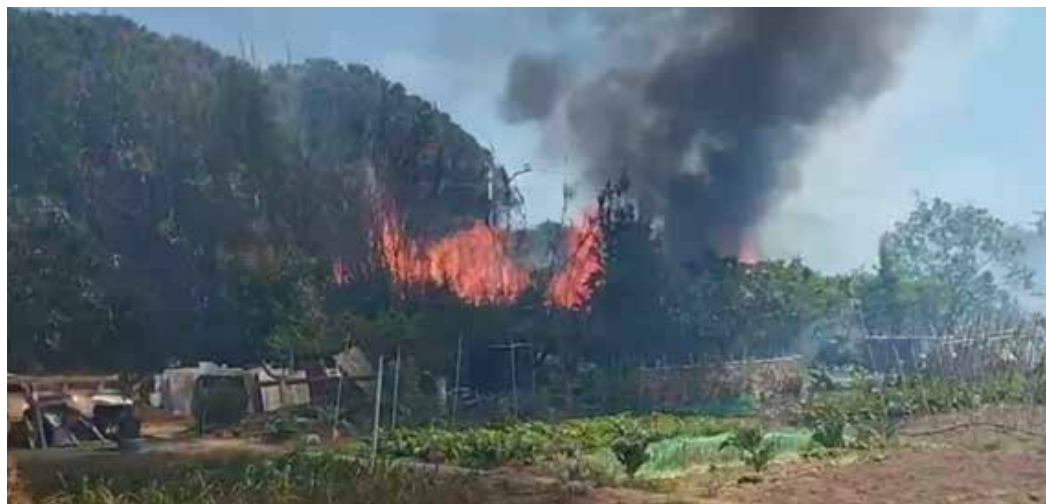
La canya és molt poc densa i seca: això en facilita molt la propagació dels incendis pels canyers

la riera del Mujal representa una oportunitat per recuperar el nostre patrimoni natural, millorar el seu sistema fluvial, augmentar la biodiversitat, estabilitzar les ribes i reduir els riscos associats a inundacions i incendis. Més enllà del control d'una espècie invasora, es tracta de restablir la dinàmica pròpia dels ecosistemes de ribera i reforçar-ne la resiliència davant de la crisi climàtica. Vegeu al blog del Sarment una versió més extensa d'aquest article.