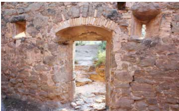
La Torreta, feta bàsicament amb pedra sorrenca

El total de la ruta, entre les dues parts, va ser d'uns 6 km. Un recorregut gairebé igual és el que es troba a l'aplicació del mòbil Natura local .