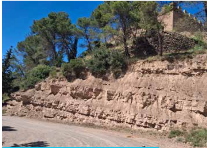
Les capes vermelloses, inclinades cap al sud, sobre què s'assenta el Castell de Balsareny (són de la Formació Artés)

Ens creuem amb el camí de la via. En la cruïlla, seguim només cent metres a la dreta (direcció a Navàs), per veure els majestuosos estrats del flanc meridional de l'anticlinal de Balsareny, inclinats cap al sud. Josep Maria Mata va comentar que l'anticlinal de Balsareny continua amb el de Súria. El de Balsareny és més lax, o sigui, el pont que fa no és gaire pronunciat, comparat amb el de Súria, que fa més pont —el poble Vell de Súria es troba sobre uns estrats molt inclinats—.