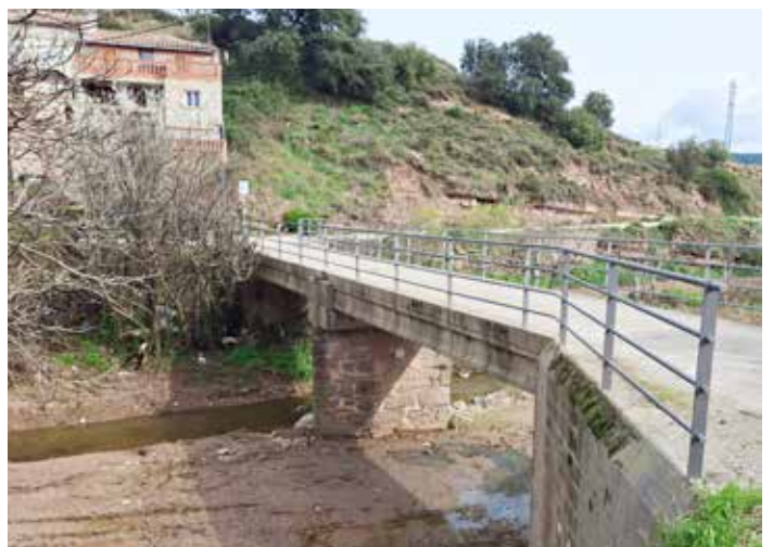
El pont sobre la riera del Mujal, on hi havia l'antiga palanca

A la falda de la muntanya agafem un camí a l'esquerra (poc abans d'arribar al Sant Antoni), que va baixant per un terra molt empedrat de calcoarenita. Al cap de poc arribem a la Torreta, el fortí carlí, que es manté força bé.