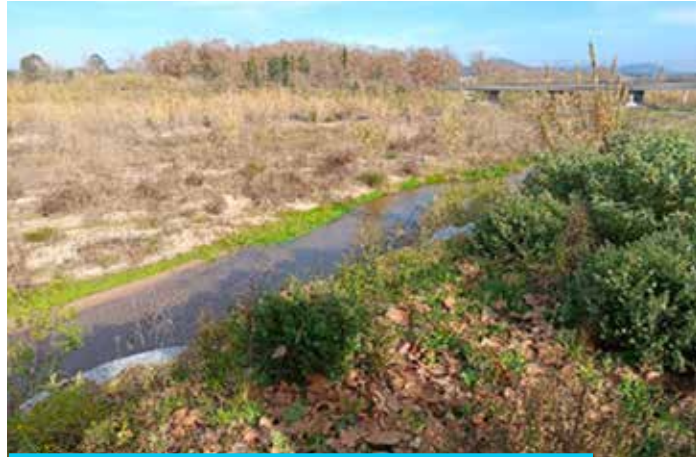
Desequilibri ecològic de la llera d'un curs fluvial colonitzat per un canyer que no hi deixa créixer el bosc de ribera

estat aprofitada en agricultura, construcció i artesanía. La sega periòdica i la crema controlada limitaven la seva expansió i afavorien la regeneració de canyes noves destinades a usos humans. Amb l'abandonament progressiu dels aprofitaments rurals tradicionals, però, la canya ha quedat sense control i s'ha expandit massivament, convertint-se en un exemple clar dels efectes ecològics derivats del canvi ambiental global que es manifesta en la pèrdua dels usos tradicionals del territori.