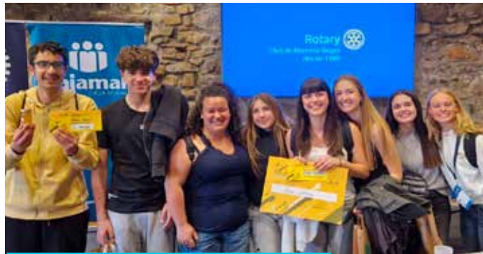
La Xènia amb els seleccionats i finalistes del premi Rotary

Després vam fer una prova escrita: en 20 minuts havíem de redactar un text sobre la