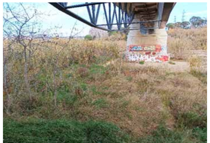
L'expansió dels canyers enmig les lleres de rius estacionals mediterranis és el veritable problema de taponament dels ponts en les riuades mediterrànies