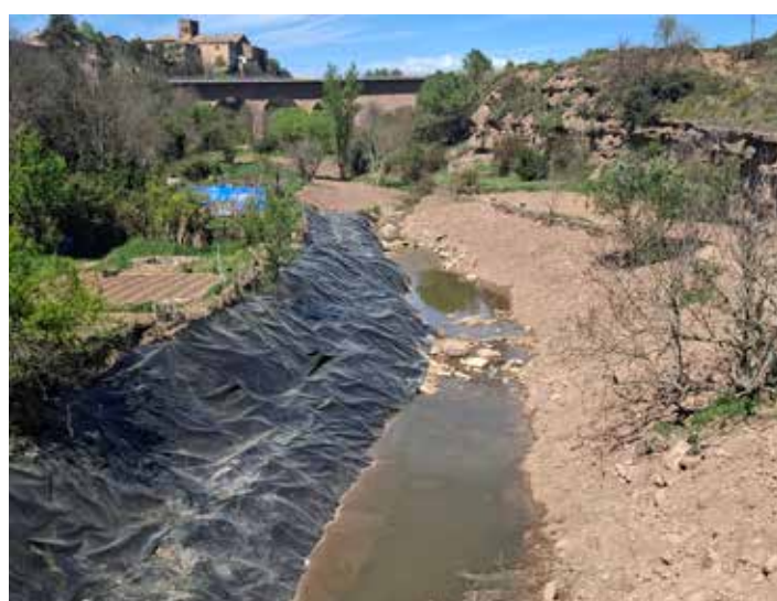
La vall de la riera del Mujal, des de l'aqüeducte de Santa Maria, on s'està arrançant la llera de la riera (fins fa poc estava plena de canyes a vessar)