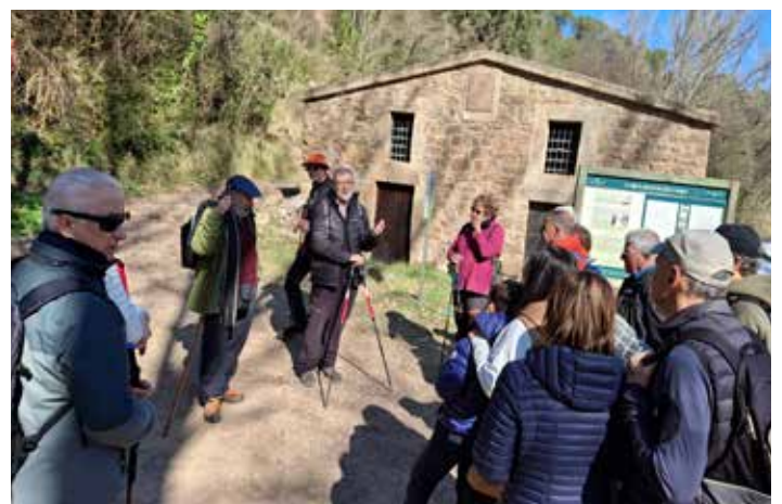
El grup al km 0 de la síquia