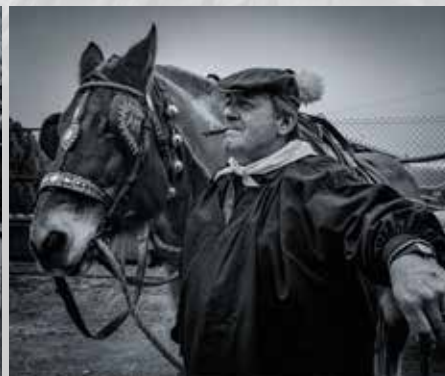
Col·lecció Honor NACIONAL Blanc i Negre MIQUEL PONS BASSA