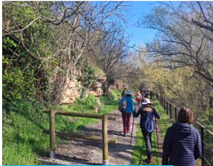
El tram de la síquia entre el pont del Riu i la resclosa dels Manresans, d'un quilòmetre i mig

Tot seguit, continuem pel Repeu, recordant que aquest nom significa "peu d'un turó", i, en aquest cas vol dir que tant el camí com tota la cinglera, es troben al peu del turó de l'església, tot i que també es pot interpretar que és al peu del turó del Castell. També vàrem observar la vall que la riera del Mujal ha excavat en milions d'anys, on darrerament s'han tallat moltes canyes invasores que hi havia (tot i que algunes han tornat a brotar), dins del pla de millora de tota la riera que porta a terme la Generalitat i l'Agència Catalana de l'Aigua, de què ja vàrem informar al Sarment d'octubre passat. Aprofitem per mostrar aquí una imatge d'aquest tram fi-