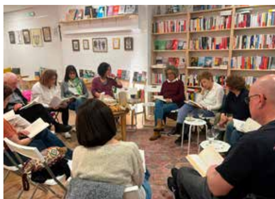
Club de Lectura de Poesia