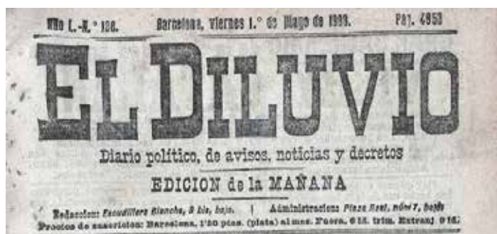
Una capçalera de 1908 d'El Diluvio (1879-1939)