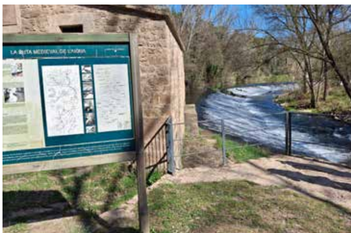
El mirador de la resclosa dels Manresans

Uns metres més enllà del quilòmetre zero de la síquia, on hi ha la caseta de control de l'aigua, descobrim el tram que es va veure alterat per les obres de la resclosa; veiem que els nous verns continuen creixent i alguns ja fan 5 o 6 metres d'alçada. Recordem que es va aprofitar per eliminar molts negundos, un auro molt invasor.