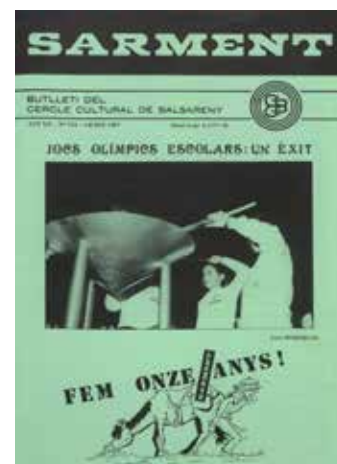
Portada del Sarment, gener 1987

estímul i il·lusió», així com de l'actuació de l'equip de bàsquet femení del "Font Vella" amb jugadores americanes.