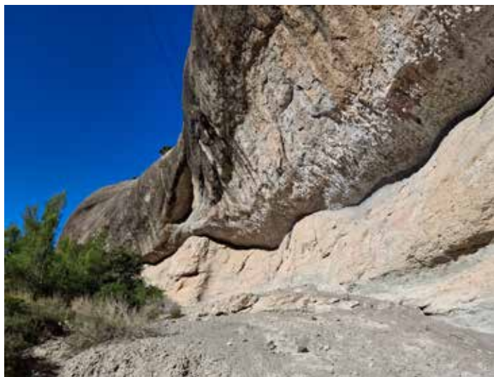
Detall de la balma: capa superior de gres, resistent; i capa inferior de margues, que es van erosionant

longitud de prop de 150 metres i una alçada màxima que supera els 15 metres, per bé que és poc fonda. Està dividida en dues capes: la superior, formada per gresos massius d'un delta que hi havia hagut fa milions d'anys, amb una gran escletxa en diagonal que la divideix en