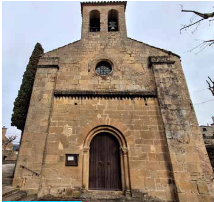
Església romànica de Talamanca

Al costat hi ha l'Ajuntament, on destaca, a la façana, una placa d'homenatge a Muriel Casals, declarada Filla Predilecta de Talamanca després de la seva mort el 2016.