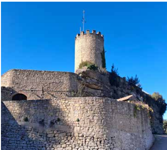
Castell de Talamanca

La impressionant balma es troba al Serrat de la Mussarra, que fa de límit entre els termes de Talamanca i Moianès. Té una »»»