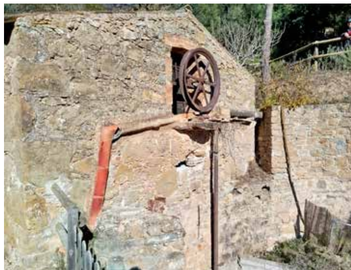
Exterior de l'antiga sinia de Can Valls, per on es feia pujar l'aigua de la riera. L'interior de la caseta també es pot veure

ma hi ha aproximadament uns 2,7 km. En tornant, desviant-nos del camí d'anada per un sender que està indicat, podem veure la balma dels Gobians, molt més petita però força fonda, en el curs d'un torrent. Ubicació: (41.74132,1.98193). I finalment, ens trobarem