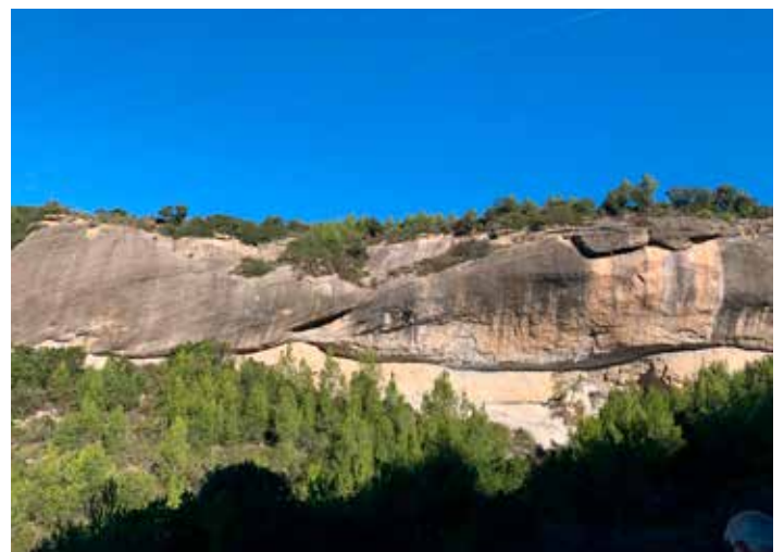
La balma de Rocagiberta, on es veu la gran escletxa en diagonal