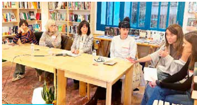
Trobada de Narradores

L'endemà diumenge, entre les 10 i les 13 h., hi va tenir lloc la primera Trobada de Narradores , un moviment creat per visibilitzar les dones creadores del Bages i del Berguedà. Es tracta d'un