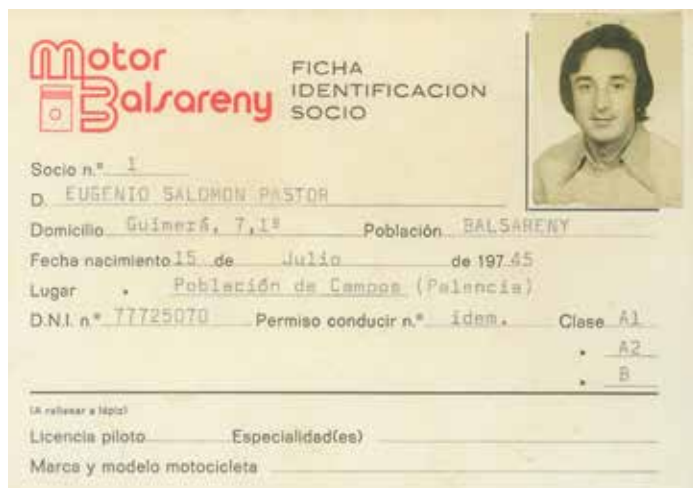
Carnet de soci

L'entitat deixà d'existir només tres anys després de formar-se, per acord pres en la junta directiva del dia 8 de març de 1978 (potser s'havia d'haver convocat una assemblea...), segurament per les dificultats inherents a l'organització de competicions de motor i a la manca de directius. Podria ser doncs l'entitat de Balsareny de més curta durada. >>>