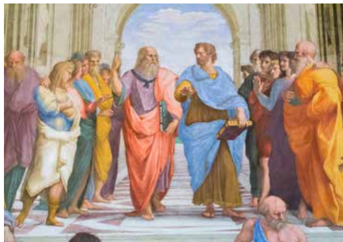
Plató i Aristòtil. Detall de L'Escola d'Atenes, de Rafael

Jostein Gaarder continua explicant en el llibre: «és lamentable que un filòsof tan important s'equivoqués tant en la seva visió de la dona.