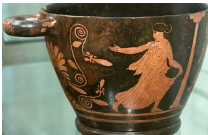
Escif de ceràmica àtica, c. 420 a.C.

Què li respondríeu, a la Sofia? Quantes dones filòsofes us venen al cap, les seves idees i obres? Potser resulta que les coses no han canviat tant, o gens, des de fa segles.