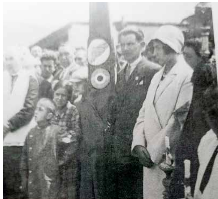
Benedicció de la bandera de la Unión Patriótica local (1927)

sernària de la tropa infantil que no les primeres lletres. És a saber, no es podia entrar a l'escola si abans la bandera no s'havia desplegat, entonant a plena veu, alhora i marcialment afilerats, com era preceptiu, el Himno Nacional, és a dir, Cara al sol . I ja, dins l'aula, sota el lema de Patria, Religión y Familia (veieu la semblança amb el de l'any 1927), guardàvem respecte i obediència cega a tota hora, sota el testimoni inquietant del Caudillo . A l'ensem, acceptàvem amb submissió incondicional la disciplina i el càstig físic amb dolor corporal inclòs, com a instrucció moral, sota la mirada imperturbable de José Antonio , situat a l'altre costat del Sant Crucifix, i que, ves per on —vaja, a quina situació tan inversemblant ens mena el desenvolupament dels fets quan van seguint el seu propi curs!—, era fill del mateix Marqués de Estella .