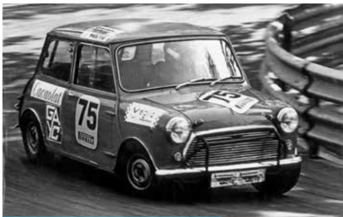
Fèlix Pastor. Mini 1000. Circuit de Montjuïc, any 1970 (?)

Mentre va estar activa va organitzar les següents proves, en la categoria de motos.