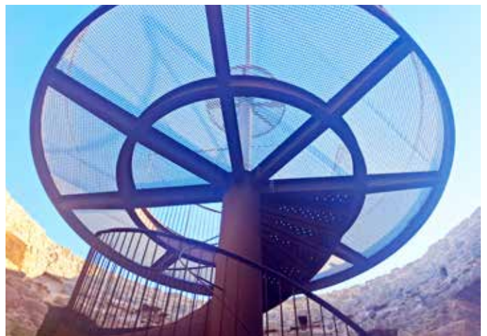
L'escala de caragol interior, que acaba amb la plataforma del mirador, col·locada el 2023