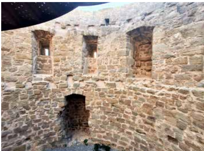
La Torre per dintre, on es veuen els murs amb espitlleres

La Torre de Santa Caterina es troba al tram final del Camí Ignasià, que porta a la Cova, i està declarada Bé Cultural d'Interès Nacional. Per fora, s'hi pot accedir en qualsevol moment; per veure-la per dintre i pujar al mirador, la porta està oberta els caps de setmana i festius.