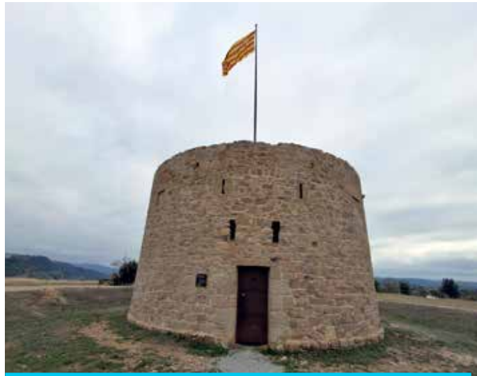
La Torre de Santa Caterina, per fora, als plans del mateix nom. Les dues obertures de sobre la porta indiquen que antigament hi hauria hagut un portal llevadís

Des de Balsareny a la Torre hi ha uns 21 km. També s'hi pot accedir per carreteres