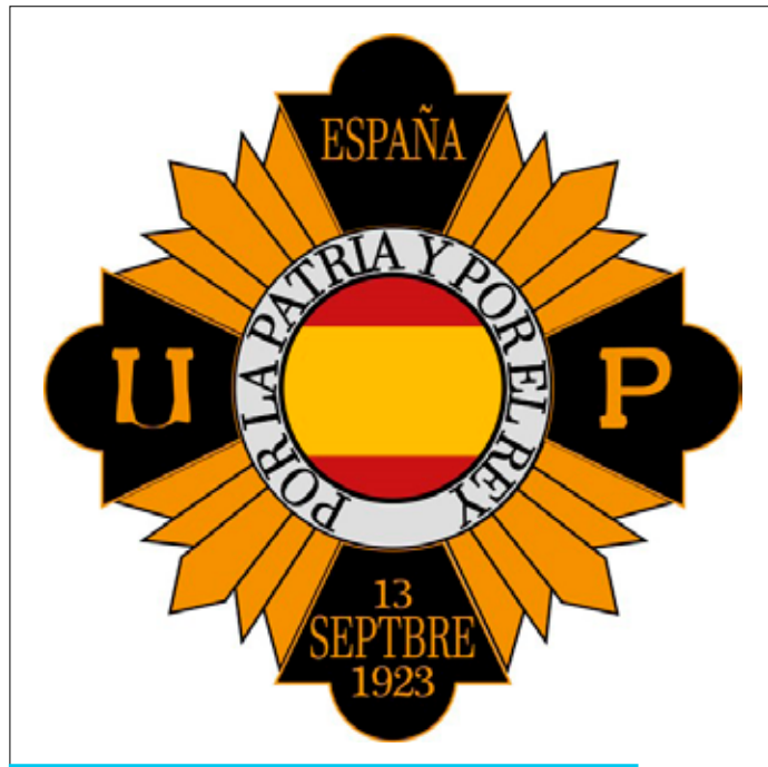
Bandera de la UP local, extreta del llibre: Balsareny, història en imatges

Abans de reprendre el fil de la crònica de l'acte inaugural de les escoles que va difondre en la seva edició del 14 de novembre de 1927 la Hoja Oficial de la Provincia de Barcelona penso que és oportú fer una breu introducció que ens serà útil per situar-nos en el transcurs dels esdeveniments d'aquell dia. En el seu moment, Unión Patriótica va ser un partit únic fundat per Primo de Rivera per a reemplaçar els partits polítics, ara prohibits. La creació del partit únic és l'essència dels estats totalitaris i té com a finalitat exercir el control i l'adoctrinament polític: cal estructurar en un pensament únic els principis ideològics del conjunt de la ciutadania, a banda de reclutar l'elit política i els càrrecs públics, que supervisaran amb un control estricte i absolut els fonaments i les estructures de l'estat. A Catalunya, el nou partit, dirigit per Andreu Gassó Vidal, no va tenir gaire recorregut perquè la seva base social fou molt exigua, insuficient del tot. La militància primorriverista, sota el lema " Patria, Religión, Monarquía ", n'aplegà partidaris del manteniment de l'ordre, defensors d'idees conservadores i dels valors tradicionals, buròcrates giracamisets, però també oportunistes que volien treure profit de la seva afiliació al partit, aduldors de tota condició, ressentits socials i