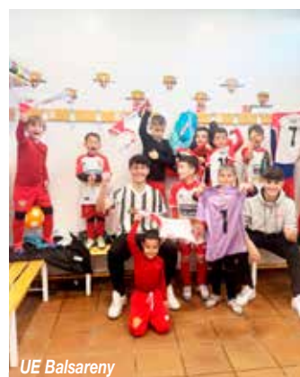
UE Balsareny Prebenjamí