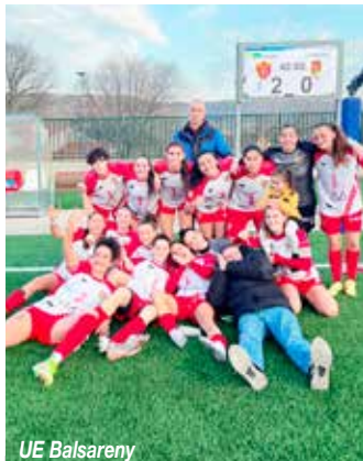
UE Balsareny Sènior femení

Partit difícil, ja que jugàvem el primer contra el segon amb una diferència de 2 punts; i complicat perquè coincidia amb Traginers i és una festa que es viu. Necessitàvem la presència dels aficionats i no van fallar: hi va haver una entrada extraordinària amb tota la grada plena, també amb seguidors de la Guardiola i del pobles veïns. El comitè d'àrbitres del Bages el va considerar de màxima categoria i per primera vegada va venir un àrbitre de l'Anoia, Gabriel Campillo, de categoria Elit (una menys que 3a Di-