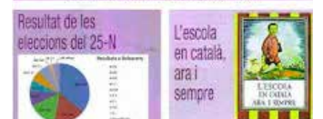
Portada Sarment Desembre 2012