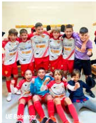
UE Balsareny Aleví