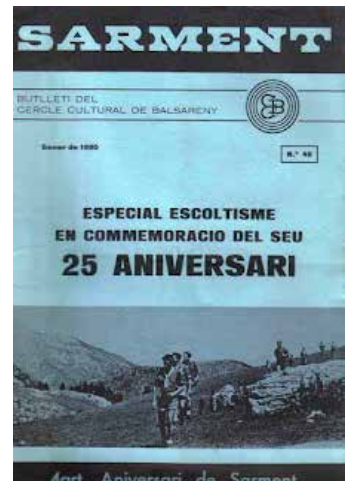
Portada Sarment Gener 1980