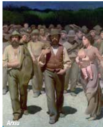
Fragment del quadre «El quart estat»

Fa uns dies, en una acció educativa amb joves, vam treballar el tema i en una primera part vam argumentar l'ideal en diversos camps referents