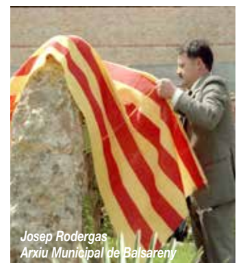
Josep Rodergas Arxiu Municipal de Balsareny