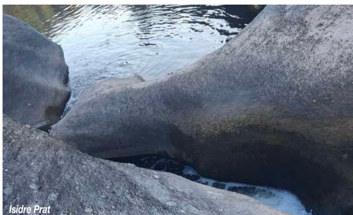
Isidre Prat La riera ha anat excavant aquestes formes sinuoses de les roques