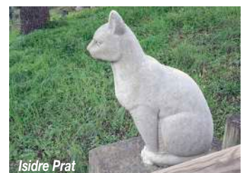
Isidre Prat Figura d'un gat, de pedra calcària, de Tomàs Bel Sabatés (1970)

Al centre del poble també hi ha escultures amb motius més moderns, i fetes amb materials com el ferro, l'acer inoxidable i l'aliatge d'alumini amb magnesi.