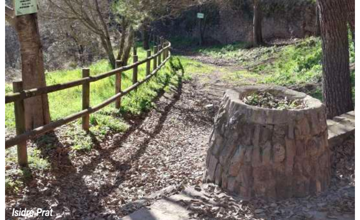
El Repeu és l'inici de la Ruta del Patrimoni i Entorn de Balsareny

Completen la biodiversitat altres espècies d'arbres, no tan nombrosos: roures; un xiprer, adossat a la rectoria, del tipus alt i estret, molt ele-