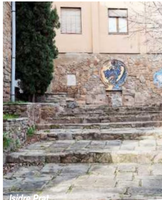
El Repeu, amb la font dels Enamorats al fons

Tot plegat forma un bonic passeig, on podem caminar i alhora conèixer la seva vegetació i fauna. És com un mirador, dalt d'un penya-segat excavat fa molts anys per la riera del Mujal, des d'on podem veure esplèndides vistes, com el Castell i Puigdorca. A més, està connectat amb altres elements importants del nostre patrimoni: al principi, la font dels Enamorats; al mig, el pont de la Via; i al final, l'aqüeducte de Santa Maria, la Síquia i el pont del Riu; així com la connexió natural de la riera del Mujal amb el riu Llobregat.